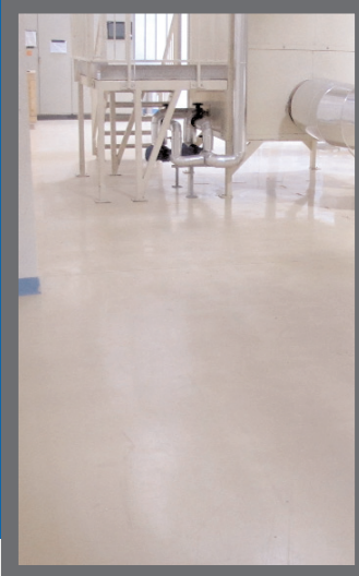
«Империл Табакко Продакшн Украина»