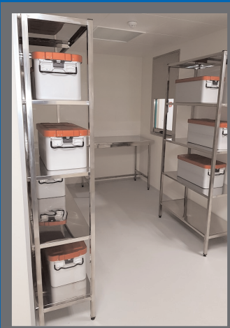
Национальная детская специализированная больница Охматдет