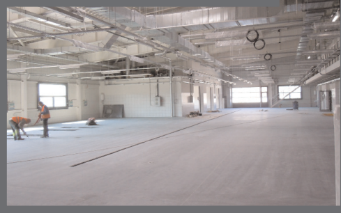
Бизнес-центр офисно— выставочных помещений в автосалоне BMW на Бориспольской трассе